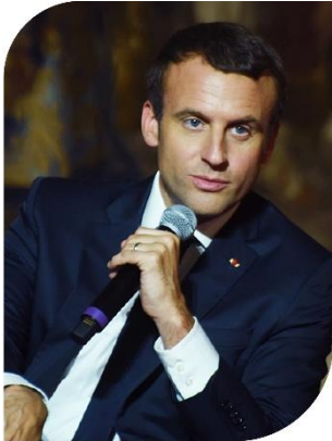
Emmanuel Macron Président de la République

Allez dans une classe avec un élève en situation de handicap. Au début de l'année, il y en a toujours pour se moquer. Que révèlent réellement ces railleries ? Elles sont le cri de faiblesse du groupe. Les enfants qui se moquent pensent déstabiliser celle ou celui qui ne leur ressemble pas, mais en réalité, c'est leur propre malaise qu'ils expriment face à ce qu'ils ne connaissent pas, leurs propres failles qu'ils mettent à jour. Ce peut être un mélange de peur, d'embarras, le sentiment de ne pas savoir comment parler de cette différence, comment agir face à l'autre.